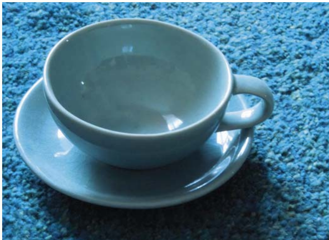
In eine volle Tasse kann nichts gefüllt werden

Stellen Sie sich selbst daher vor, wie Sie sein möchten, ohne in die Fantasie zu verfallen, gleich stärker als Obelix, hübscher als Schneewittchen, schneller als Lucky Luke und reicher als Dagobert Duck sein zu wollen. Machen Sie sich ein möglichst genaues Bild von Alltagssituationen, und wie Sie sich in diesen verhalten möchten. Wenn Sie dann in eine solche Situation geraten, rufen Sie dieses Bild und die dazugehörigen Gefühle in sich wach und begegnen Sie der Situation mit genau dieser inneren Projektion. Je öfter und je klarer Ihnen dies gelingt, umso mehr wird Ihre gedankliche Projektion Realität. Sie werden, was Sie denken. □